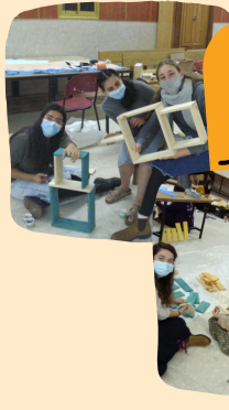
סדנת נגרות הייתן מקוריות