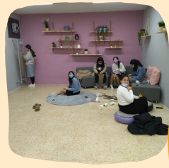
מקרמה לשביעית ותודה לפדות ויאלו שהלכו לקנות