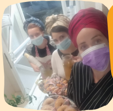
צוות פנימיה מפנק אין עליכין!