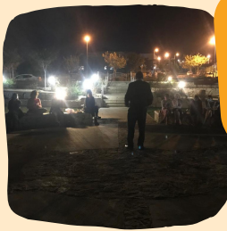
עד אלייך עם הרב קאכח