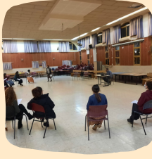
מדרשת אביה גם בבית וגם ביום מה הואו שאר?