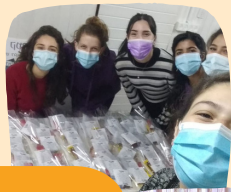
השמינית בהכנות לשבת היה מפנק. תודו