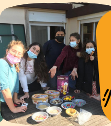
מפגשי פנים אל פנים טוב לראות אתכן!